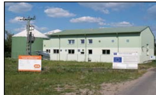
bioplynka Vysoké Mýto (2x)