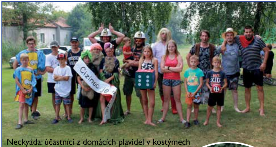
Neckyáda: účastníci z domácích plavidel v kostýmech