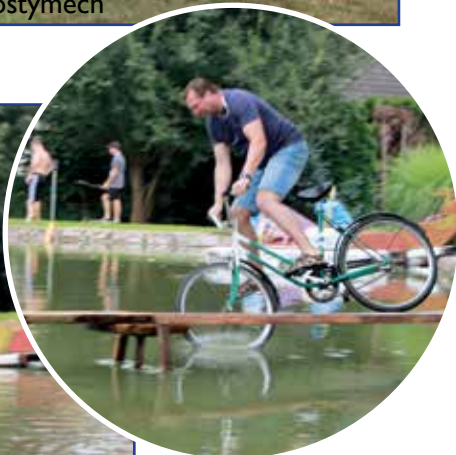
Neckyáda: po skončení oficiální části vznikla nová disciplína

Vydává OU Choteč, Pardubická 34, IČO: 00273651, MK ČR E11211.